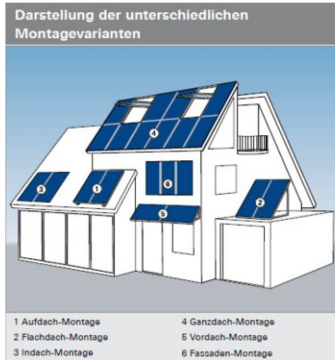
Bild Schüco Solar Montagevarianten

Blogbeitrag vom 13.03.2011 auf www.gerenda-solar.de