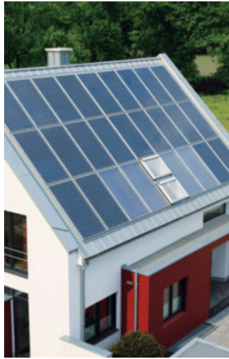
Bild Schüco Solar Ganzdach